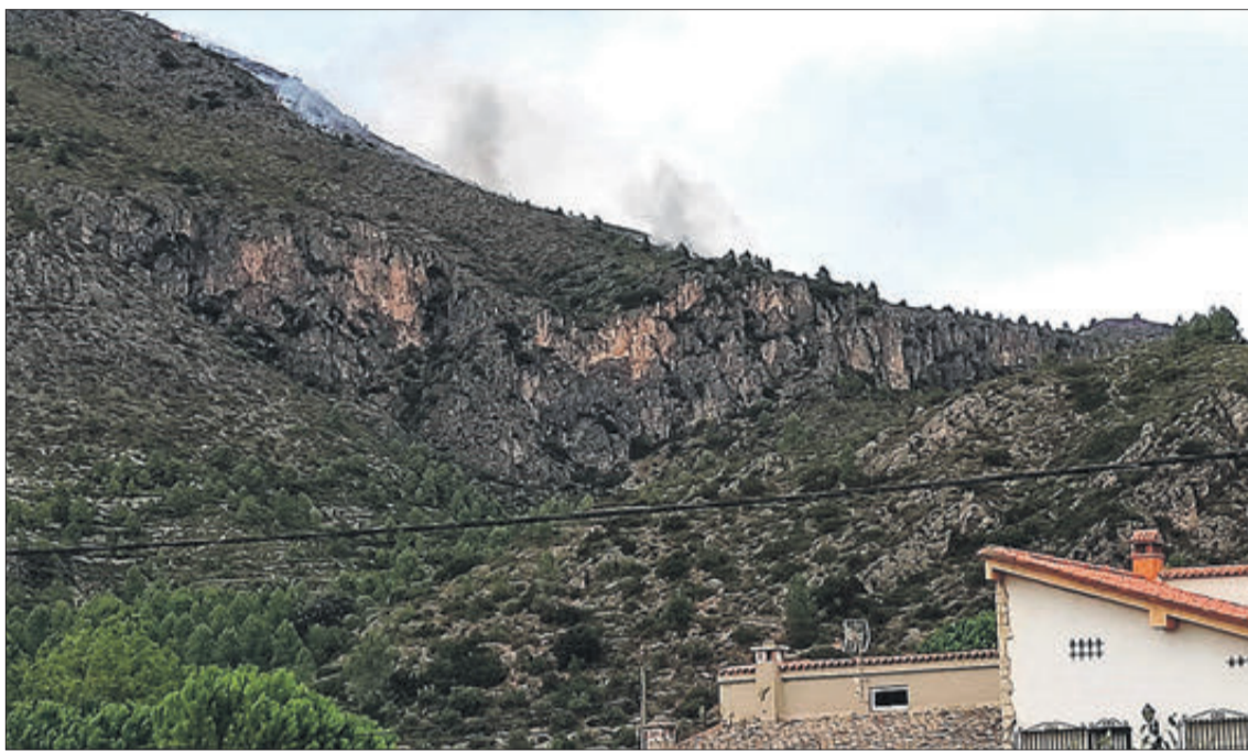
El incendio y el humo era perceptible desde distintas zonas de El Comtat.

"Volem seguir amb aquestes actuacions perquè ens juguem el nostre medi ambient i desitgem salvar el nostre entorn, que és part fonamental per a evitar el despoblament i determinant en el nostre creixement turístic i comercial", va agregar tot seguit.