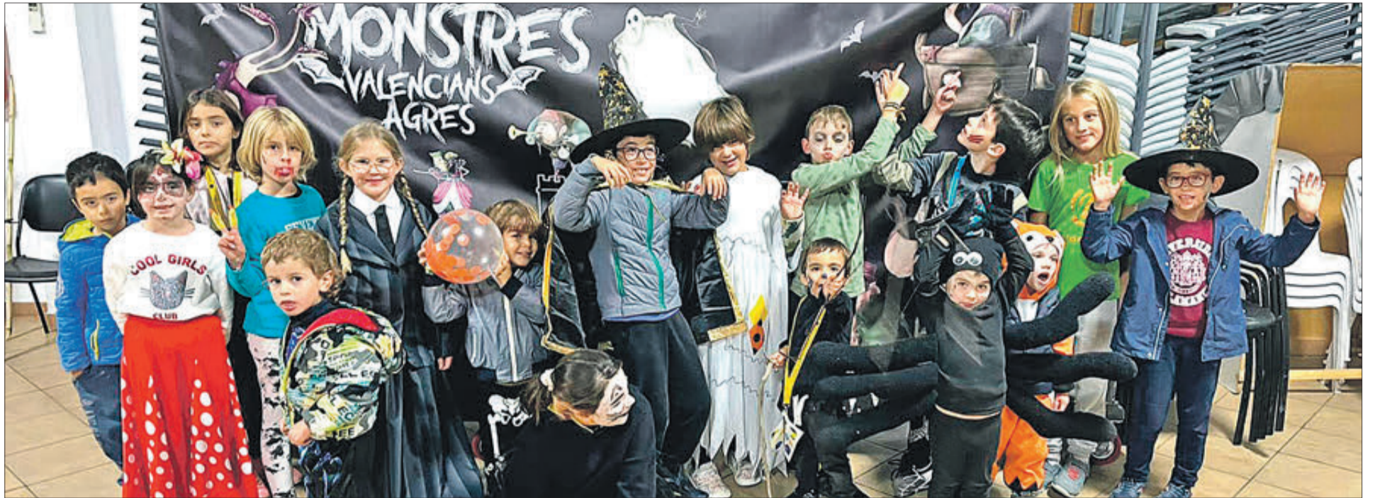
Grup de joves d'Agres que van participar en l'activitat el passat 31 d'octubre.

AL VOLTANT DE 60 JOVES VAN PARTICIPAR I VAN ESTAR BUSCANT-LOS PER LES CASES DE LA LOCALITAT