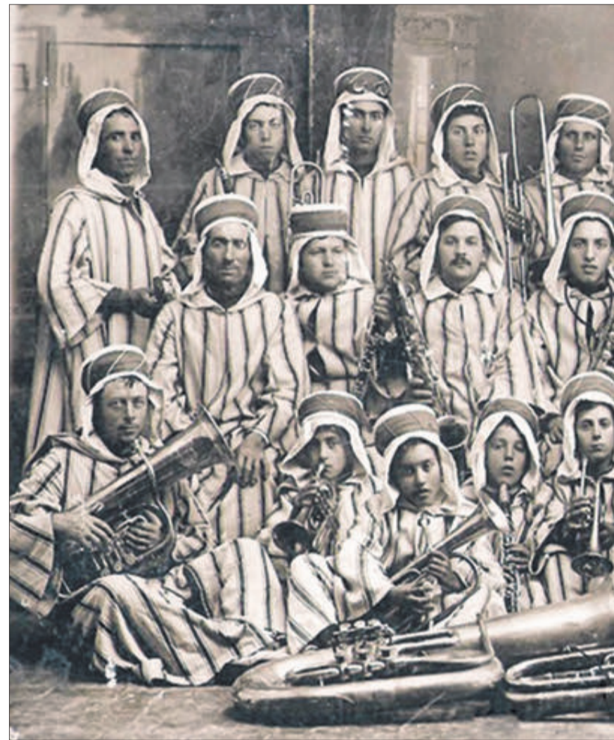
Imatge de la banda corresponent a 1910

La Banda de Música de Penàguila és un dels valors més emblemàtics de la localitat, gràcies als seus més de 150 anys d'història, en els quals mai ha deixat d'existir de la mà de nombrosos relleus generacionals i el treball i la constància dels membres de la societat.