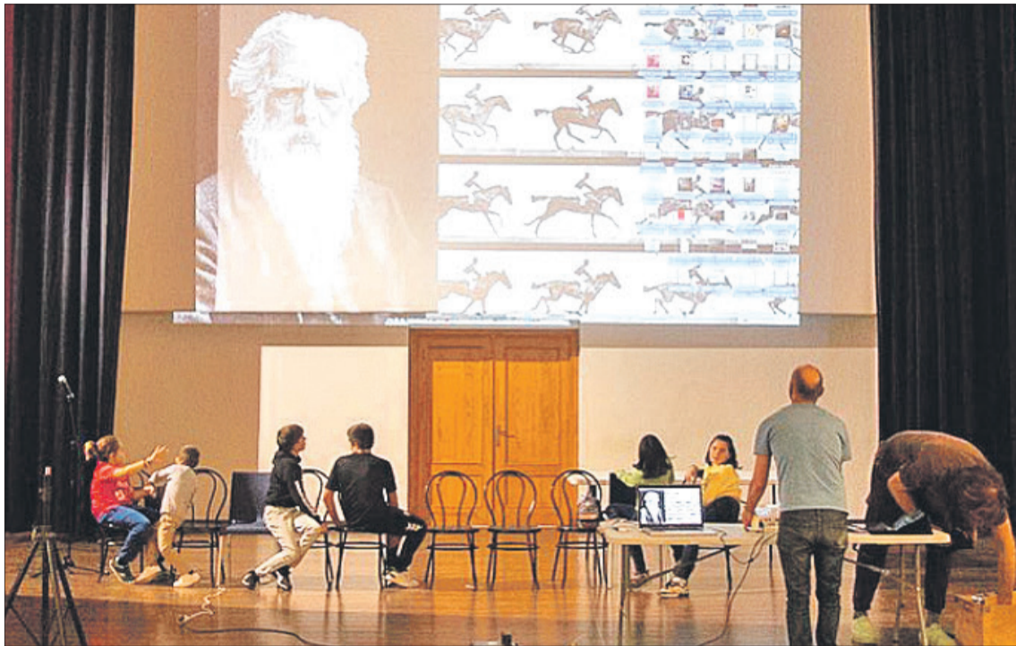
El certamen es va celebrar a l'auditori Juan Andrés.