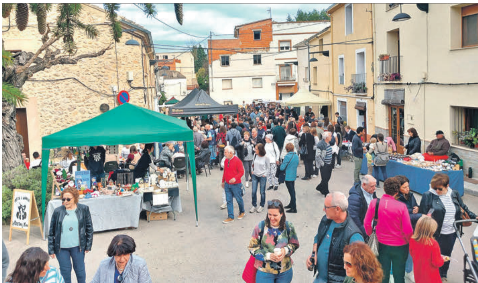
Santa Cecília celebra durant tres caps de setmana

La sempre dinàmica localitat d'Alfafara va celebrar aquest mes de novembre la novena edició de la Fireta de Santa Cecília, amb nombrosos actes que van començar amb la celebració de l'obra de teatre 'Guardes al Camí' el dissabte 4. Una setmana més tard estava previst el correfoc, que va haver de ser suspès en estar en nivell tres de preemergència per incendi forestal. Sí que va ser un èxit la fireta de Santa Cecília, amb inflables per als xiquets al matí i concert a partir de les 18 hores en el patronat a càrrec del grup de dolçainers La Xafigà de Muro. Per al següent cap de setmana queden el concert -divendres 17-, Nit de la Foguera (dissabte 18) i Festivitat de la Patrona (diumenge 19).