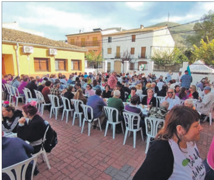
El pati de les antigues escoles va acollir algunes activitats.