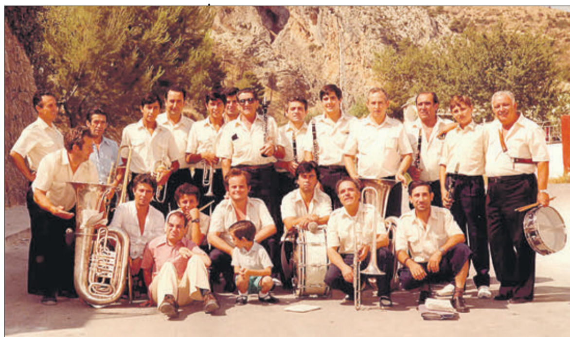
La banda en els anys 80 del passat segle.