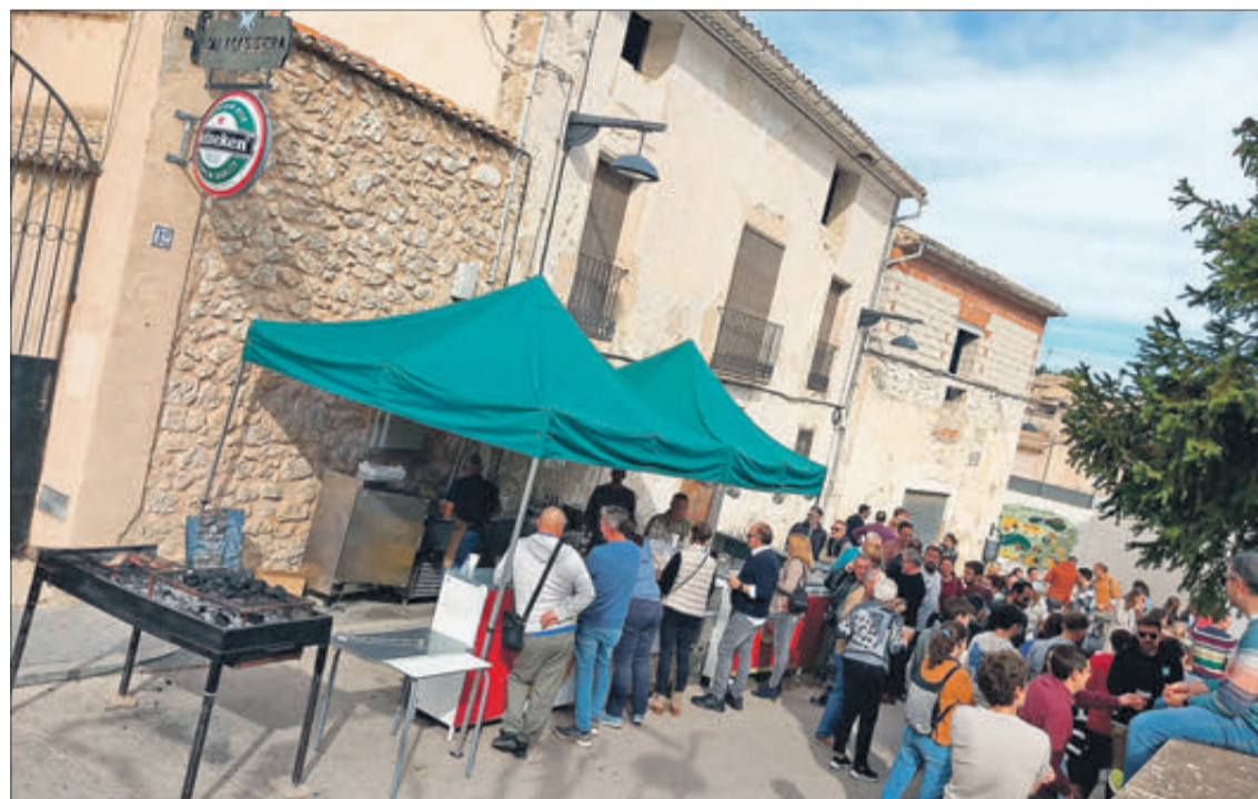
La Fireta de Santa Cecília va omplir de gent els voltants de la Mateta.

AMB NOMBROSOS ACTES DURANT EL MES DE NOVEMBRE