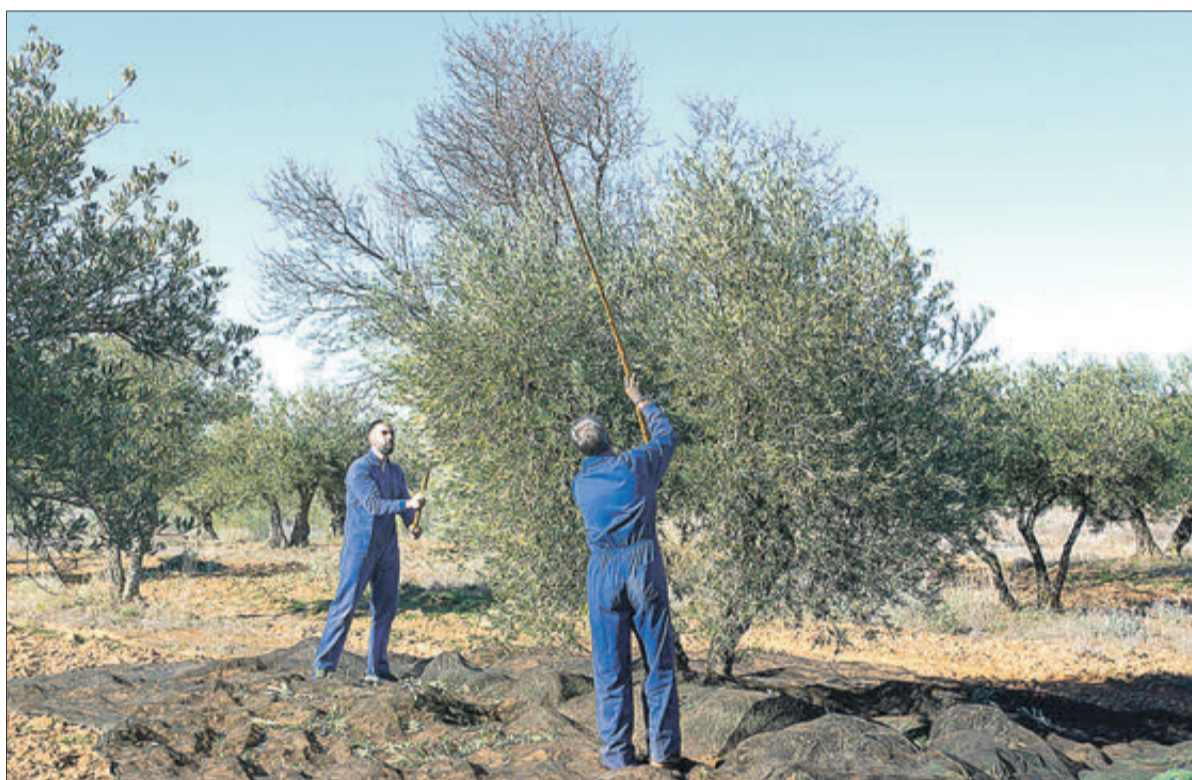
Operaris durant el procés de recol·lecció de l’oliva.