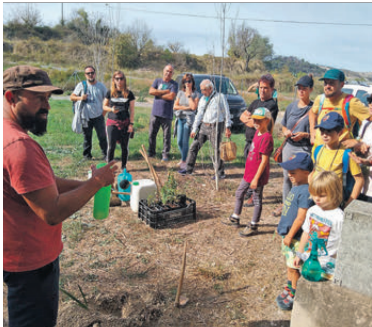
Les activitats es van centrar en el turisme actiu, amb rutes senderistes, barranquisme, etnobotànica, espeleologia i un mercat de proximitat artesà.