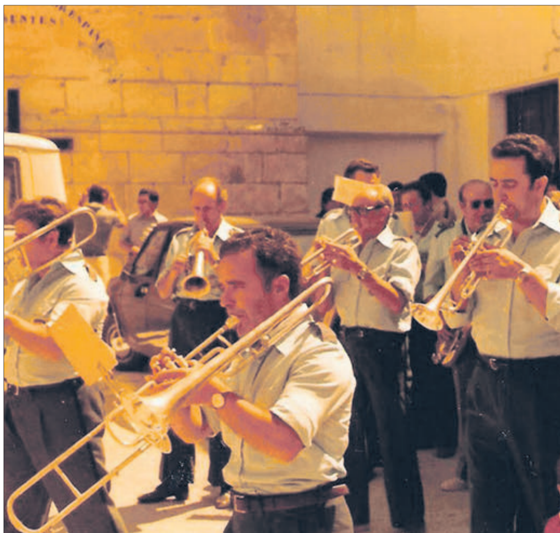
Músics de la banda, durant unes festes.