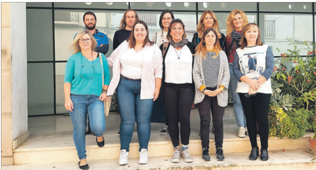
El equipo que trabaja para la Mancomunitat.