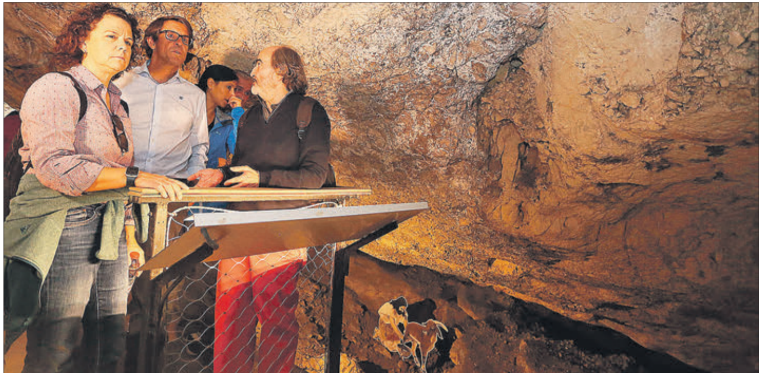
Un moment de la visita a la Cova de l'Or.