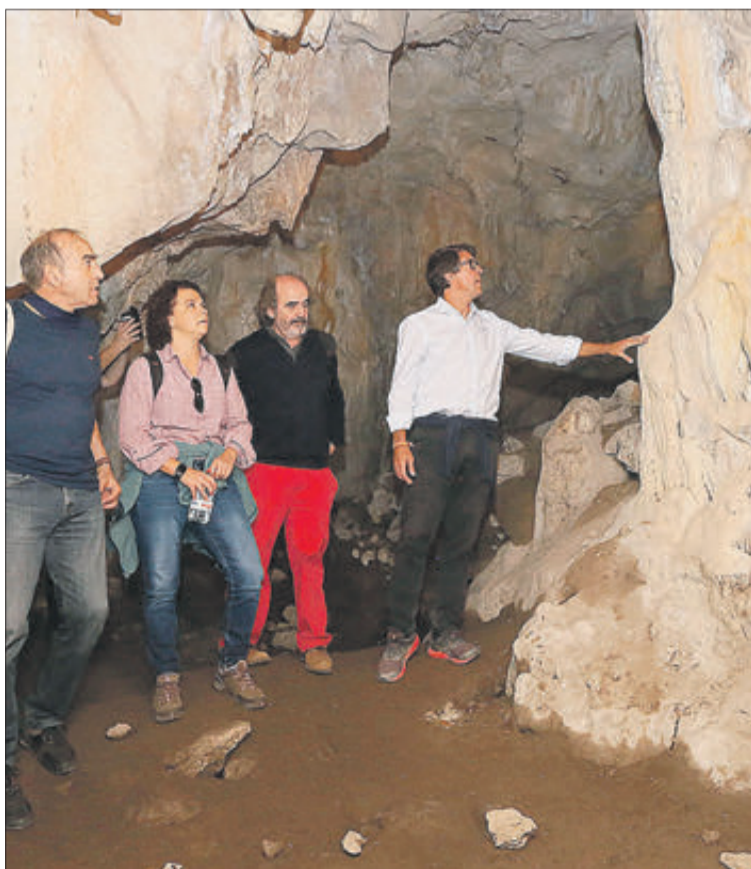
La Cova de l'Or es un dels referents del Neolític en la Comunitat.

El jaciment resulta fonamental per a entendre el Neolític de la façana mediterrània de la Península Ibèrica i permet gaudir del patrimoni mediambiental i paisatgístic de l'entorn de la serra del Benicadell.