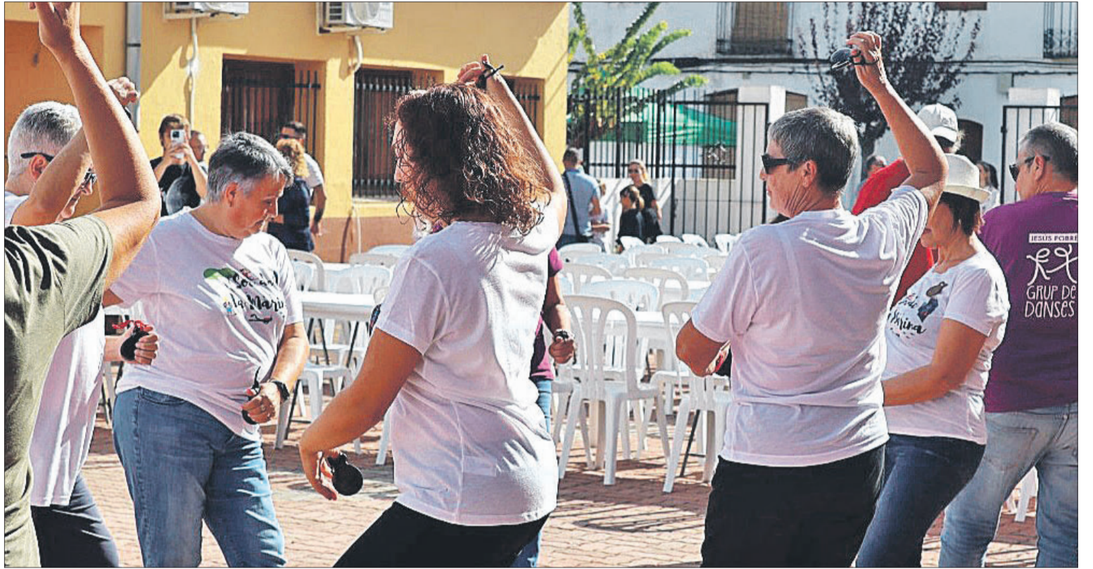
Música i danses van formar part de la programació de l'aplec.

Per últim, el colofó va tenir lloc amb la lectura del manifest per part de cinc xiquets i xiquetes vinguts de Pego, La Vall d'Ebo, Sagra, l'Atzúbia i Orba, posant punt final a una trobada molt especial.