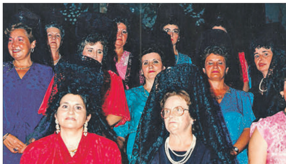
L'any 1986 les dones dels músics van ser les festeres majors.