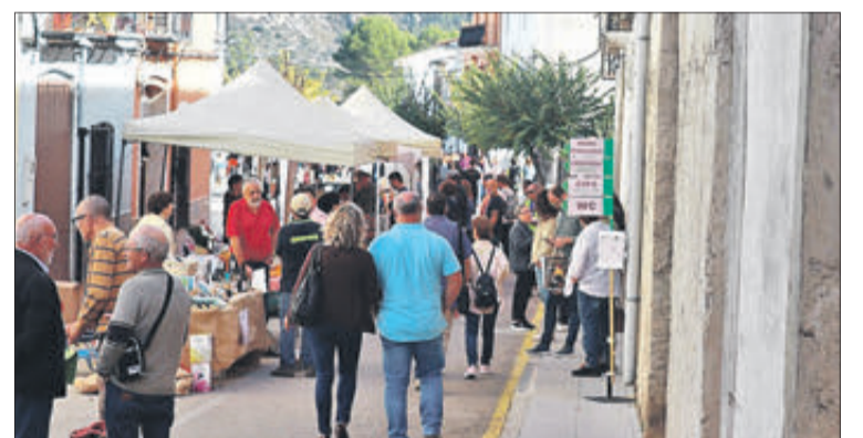
Els carrers de La Vall d'Ebo es van omplir de gent.