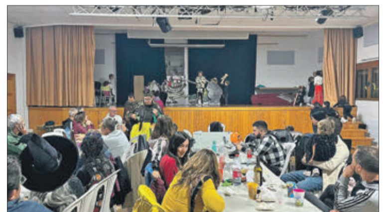
Diferents moments del desenvolupament pel poble d'Agres de Monstres Valencians.

La versió digital de XARPOLAR el nostre la trobaràs en www.elnostreciutat.com El periòdic de la Mancomunitat El Xarpolar